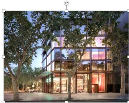
Casa SEAT (2020)