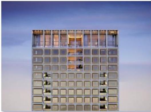
Mandarin Oriental Barcelona (2021)

Imágenes – muestra de algunos de los proyectos desarrollados por KKH Property Investors recientemente en España: