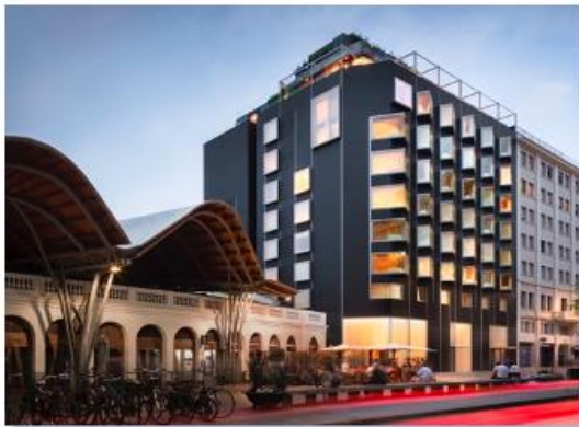
Hotel The Barcelona EDITION (2019)