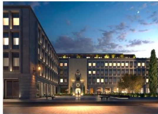
Hotel The Madrid EDITION (2021)